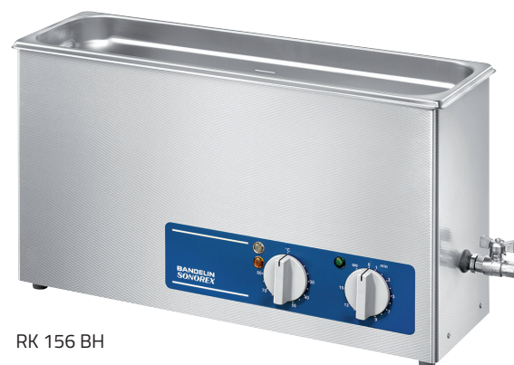
RK 156 BH

Cuves à ultrasons de haute puissance pour le nettoyage ou le traitement des échantillons dans solutions aqueuses