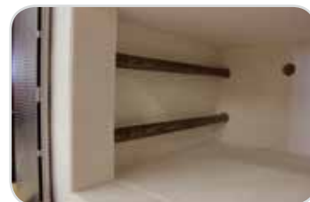
Topná tělesa v trubkách z křemenného skla