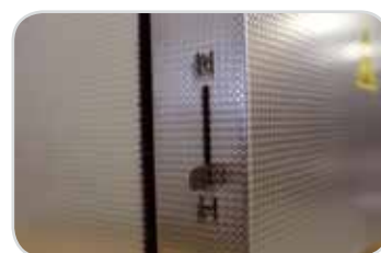
Šoupátko ve dveřích pece