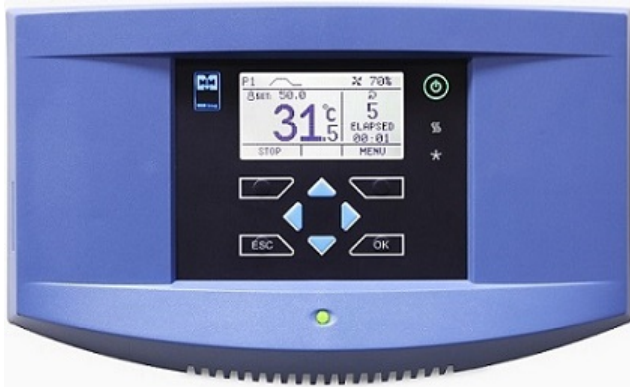
Ovládací panel řady ECO line