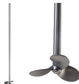
Grafické zobrazení proudění míchané látky při použití různých tvarů míchadel