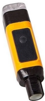
Bezdrátové moduly IDS WLM