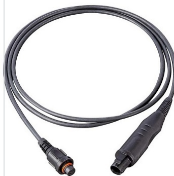
Propojovací kabely AS/IDS