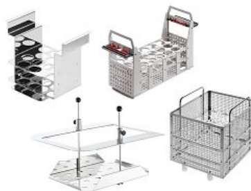
Přehled kompatibility příslušenství s oběhovými termostaty Julabo

Kromě níže vybraných produktů nabízíme také široký výběr příslušenství v přiloženém PDF souboru ke stažení umístěném pod objednávací tabulkou. V této nabídce naleznete mimo jiné i univerzální příslušenství (USB kabely, různé typy adaptérů, hadiček), kalibrační a výrobní certifikáty či řídicí laboratorní software – v případě zájmu o toto příslušenství či podrobnější informace kontaktujte produktového specialistu.