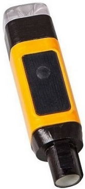
Bezdrátové moduly IDS WLM